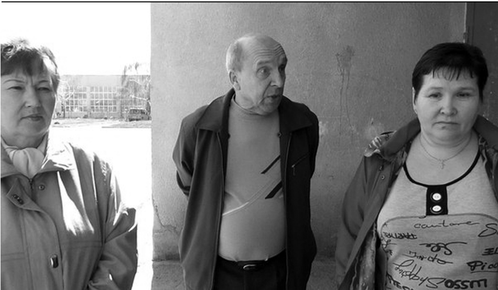
Жители посёлка Подгорный возмущаются, что местные депутаты не работают и оставили их один на один со своими проблемами

Жители посёлка Подгорный обратились в ЦГВ за помощью. Дело в том, что депутаты поселения Подгорное бездействуют, даже не ведут приём жителей, из-за чего подгорненцы остаются с проблемами один на один и вынуждены бороться за свои права сами