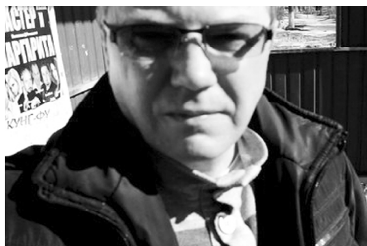
Таксист, который чуть не разбил камеру

В субботу, 30 марта, силами "Дорожного патруля" была проведена акция по претовращению нарушений ПДД со стороны автомобилистов возле Центрального рынка. Главная проблема на данном участке - незаконная парковка (по большей части со стороны таксистов), которая затрудняет движение общественного транспорта.