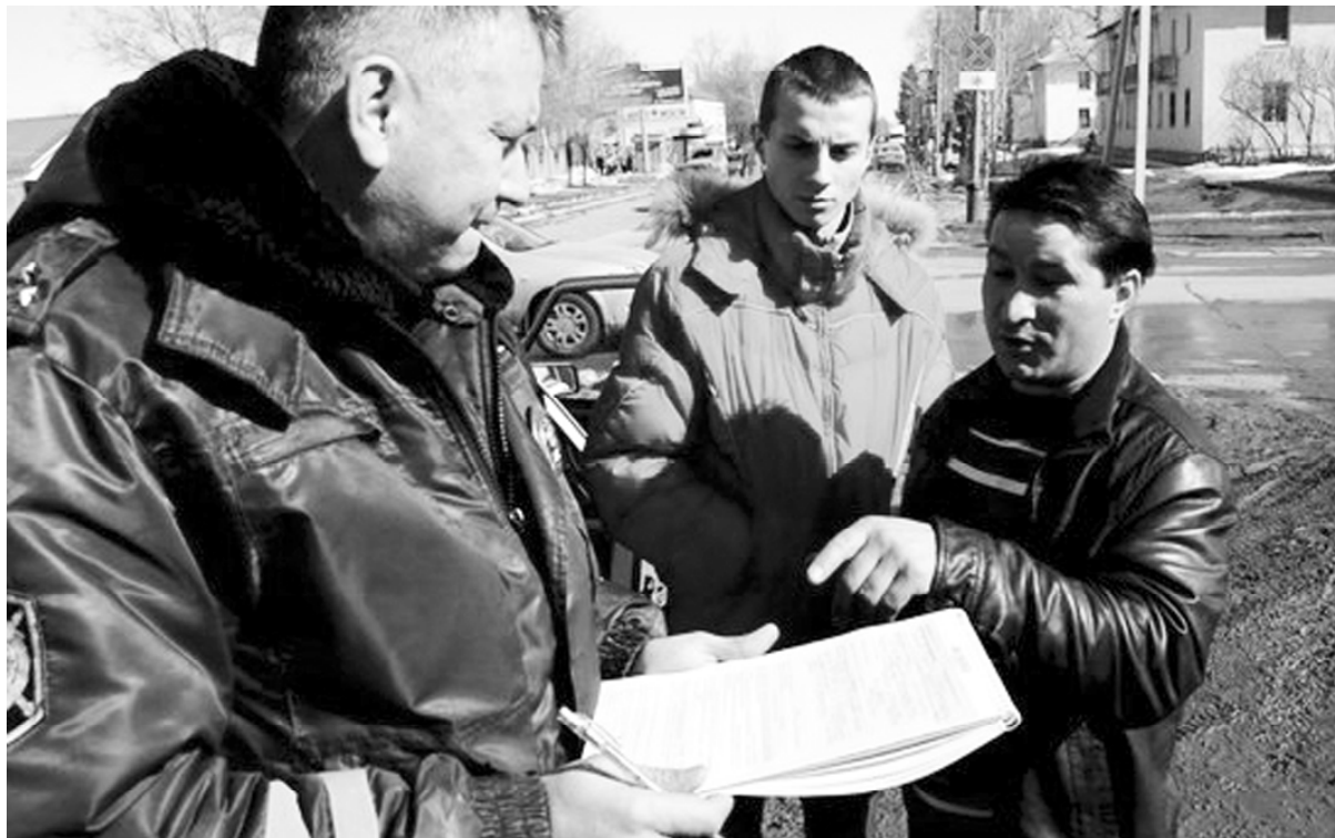
Нарушитель объясняет инспектору ДПС, что не заметил знак, запрещающий остановку

В ЦГВ обратился пользователь сайта otradny63.com под ником Joker. Он поднял серьёзную для Отрадного проблему - частые автомобильные заторы на некоторых участках города (Центральный рынок в выходные дни, рынок в 40-м квартале и т.д.). ЦГВ, в свою очередь, переадресовал данную тему волонтерам местного движения "Дорожный патруль"